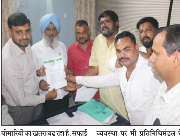
बीमारियों का खतरा बढ़ रहा है। सफाई व्यवस्था पर भी प्रतिनिधिमंडल ने

केवल रात्रि के समय पानी दिया जाता है, जिससे महिलाएं, बुजुर्ग एवं नौकरीपेशा लोग पानी का संग्रह नहीं कर पाते। वहीं कई क्षेत्रों में पानी का दबाव इतना कम रहता है कि अंतिम छोर तक पानी पहुंच ही नहीं पाता, जिससे लोगों को पेयजल के गंभीर संकट का सामना करना पड़ रहा है। ज्ञापन में डोर-टू-डोर कचरा उठाव व्यवस्था की बहाली पर भी गंभीर चिंता व्यक्त की गई। नगर निगम के कई वार्डों एवं मोहल्लों में नियमित कचरा उठाव नहीं होने के कारण सार्वजनिक स्थानों पर कचरे का अंबार लगा हुआ है, जिससे गंदगी, दुर्गंध एवं संक्रामक