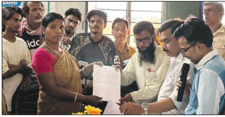
उठा रहे हैं. आधार पर निष्पादन किया जा रहा है. कई मामलों में ऑन-द-स्पॉट जांच एवं सत्यापन कर तत्काल