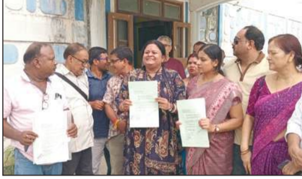
साथ लेकर चलने में असफल रही है। उनका कहना है कि पार्टी के भीतर सन्मन्य की कमी और कार्यशैली को लेकर मतभेद के कारण यह कदम