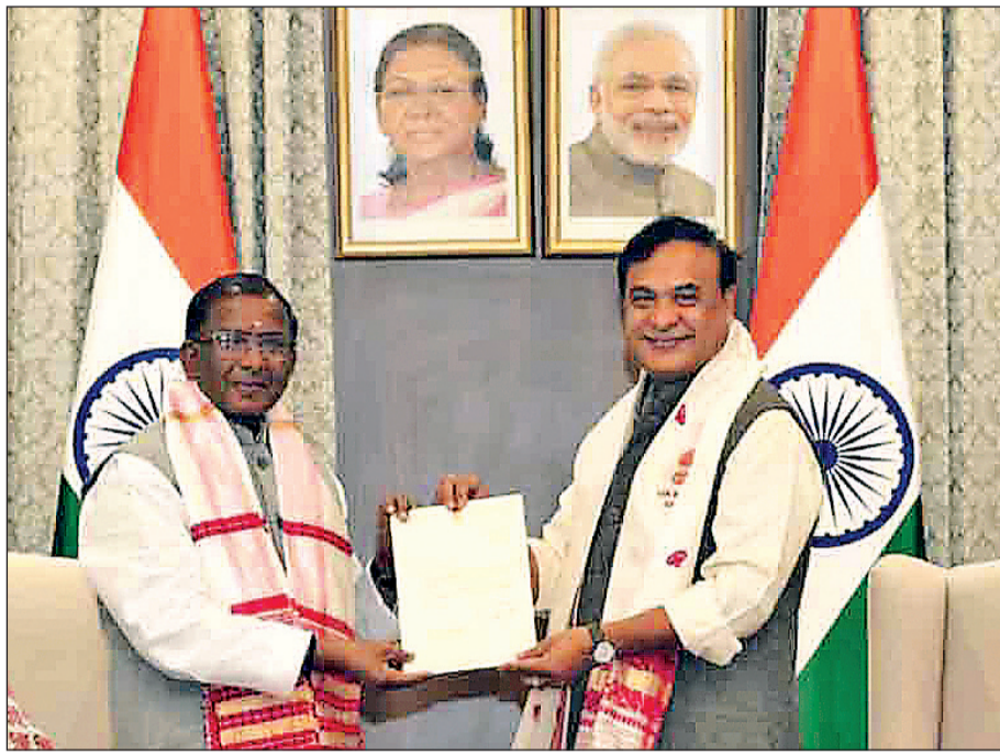
नरेंद्र मोदी 11 मई तक व्यस्त हैं और उसके बाद ही राज्य का दौरा कर सकेंगे।

बाद में लोक भवन के बाहर पत्रकारों से बातचीत में शर्मा ने कहा कि शपथ ग्रहण समारोह 11 मई के बाद होने की संभावना है। उन्होंने कहा, यह ऐतिहासिक जीत है, इसलिए हमने इस अवसर पर उपस्थित होने के लिए प्रधानमंत्री नरेंद्र मोदी को आमंत्रित किया है। शर्मा ने कहा कि प्रधानमंत्री कार्यालय (पीएमओ) ने सूचित किया है कि