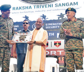
प्रोटेक्टिव गियर के विनिर्माण का केंद्र बिंदु बन गया है. मुख्यमंत्री ने कहा, लखनऊ में ब्रह्मोस मिसाइल और भारी रक्षा विनिर्माण पर ध्यान दिया गया है. चित्रकूट और आगरा को वैमानिकी और रक्षा में सटीक इंजीनियरिंग के गढ़ के रूप में विकसित किया जा रहा है.

प्रयागराज: उत्तर प्रदेश के मुख्यमंत्री योगी आदित्यनाथ ने बुधवार को कहा कि उत्तर प्रदेश के छह रक्षा औद्योगिक गलियारों लखनऊ, कानपुर, झांसी, आगरा, अलीगढ़ और चित्रकूट के लिए 35,000 करोड़ रुपये से अधिक के निवेश प्रस्ताव जमीनी धरातल पर उतरते हुए दिखाई दे रहे हैं. यहां न्यू कंट में आयोजित तीन दिवसीय 'नॉर्थटेक सिंपोजियम' के समापन समारोह में मुख्यमंत्री ने कहा, प्रदेश सरकार ने एक बड़ा भूमि बैंक तैयार किया है. रक्षा और वैमानिकी नीति के माध्यम से निवेश इच्छुक निवेशकों को प्रोत्साहन भी उपलब्ध कराया जा रहा है. उन्होंने कहा, अलीगढ़ में छोटे हथियारों, रक्षा उपकरणों और सैन्य सामग्रियों के उत्पादन के रूप में यह केंद्र उभरा है. इसके साथ ही परंपरागत रूप से तहत के मैनचेस्टर' कहलाने वाला कानपुर गोला-बारूद, मिसाइल, डिफेंस टेक्सटाइल और