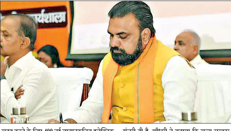
सुदृढ़ करने के लिए 400 नई वातानुकूलित इलेक्ट्रिक बसों के परिचालन को मंजूरी दी है. अधिकारी ने बताया कि प्रधानमंत्री ई-बस सेवा योजना के तहत पटना को 150 बसें तथा मुजफ्फरपुर, भागलपुर, गया, दरभंगा और पूर्णिया को 50-50 बसें उपलब्ध कराई जाएंगी. उन्होंने बताया कि इसके लिए सरकार ने 517.16 करोड़ रुपये के पुनरीक्षित व्यय को मंजूरी दी है. चौधरी ने बताया कि राज्य सरकार ने सड़कों के रखरखाव और निगरानी व्यवस्था को तकनीक आधारित बनाने का फैसला किया है तथा इसके तहत 15,967 करोड़ रुपये की लागत से राज्य की 19,305 किलोमीटर लंबी सड़कों की निगरानी कृत्रिम मेधा और मशीन लर्निंग तकनीक से की जाएगी. उन्होंने बताया कि इसके लिए पटना में एक