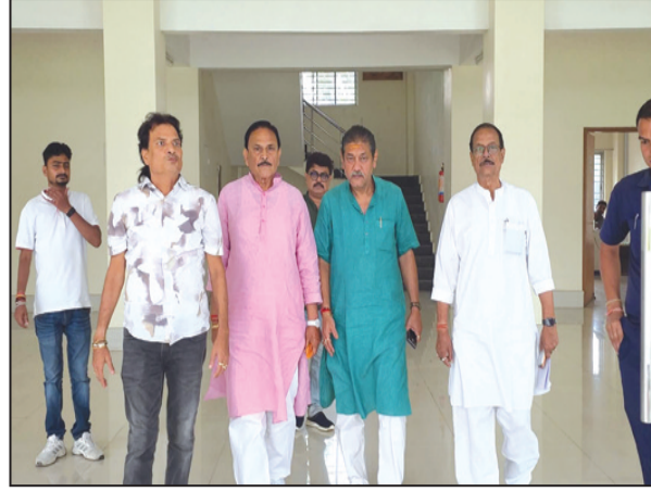
जानकारी देते हुए सख्त कार्रवाई की मांग की। उन्होंने मांग की कि सभी घटनाओं में तुरंत एफआईआर दर्ज की जाए, दोषियों की पहचान कर कड़ी

कार्यकर्ताओं पर हमले किए गए, जबकि पार्टी कार्यालयों और सरकारी संस्थानों पर कब्जा करने की शिकायत की गई है। तृणमूल नेताओं के अनुसार, जिले के कई हिस्सों में पार्टी कार्यालयों को निशाना बनाकर तोड़ा गया, महत्वपूर्ण दस्तावेज और सामान लूट लिए गए और कई जगहों पर आग लगा दी गई। आरोप है कि हजारों कार्यकर्ताओं के घरों पर हमले किए गए, महिलाओं के साथ दुर्व्यवहार हुआ, अल्पसंख्यकों पर दबाव बनाया गया और स्थानीय व्यापारियों को आर्थिक रूप से प्रताड़ित करने की घटनाएं भी सामने आई हैं। प्रतिनिधिमंडल ने पुलिस आयुक्त को इन सभी घटनाओं की विस्तृत