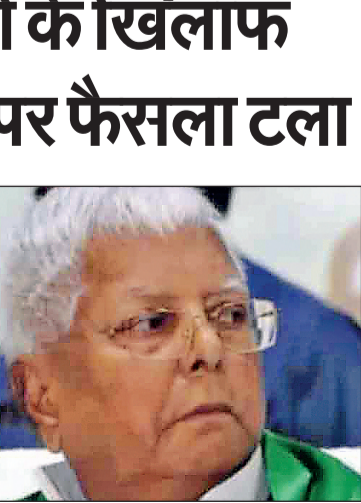
खिलाफ आरोप तय करने का आदेश दिया है. कोर्ट ने 17 सितंबर 2018 को इसी की ओर से धारा चार्जशीट पर संज्ञान लिया था. इन मामलों में लालू प्रसाद यादव, राबड़ी देवी समेत 16 लोगों को आरोपी बनाया गया है.