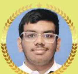
AARUSH 93.6 %