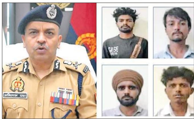
सामने आई है कि ये सभी अभियुक्त सोशल मीडिया और वीडियो कॉल के माध्यम से