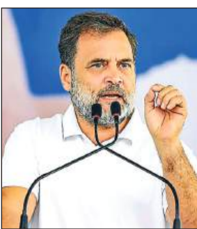
लाख बच्चों का भविष्य सौंप दिया गया और किसी को फ्रकं नहीं पड़ा. उन्होंने कहा, यह गलती नहीं - यह सौंचा-समझा पड़घंटा है. गांधी ने सरकार से पूछा, कुछ जरूरी सवाल हैं: सीओआईएमपीटी को सीबीएसई का

गांधी ने 'एक्स' पर एक पोस्ट में कहा, सीबीएसई परीक्षा परिणाम में बहुत बड़ी हेरफेर हुई, जिससे देश के लाखों बच्चे और उनके माता-पिता सदमे में हैं. लोकसभा में विपक्ष के नेता ने कहा, हमारे प्रधानमंत्री नरेन्द्र मोदी जी? प्रेम्शा की तरह - न जवाब, न ज़िम्मेदारी, न शर्म. उन्होंने दावा किया कि जिस कंपनी सीओआईएमपीटी को यह जिम्मेदारी मिली, वह पहले 'ग्लोबरीना' के नाम से तेलंगाना में 2019 में यही कारनामे कर चुकी है. उन्होंने कहा कि नाम बदला लेकिन नीयत वही और फिटरत वही रही. गांधी ने दावा किया कि इतिहास सबको पता था, फिर भी ठेका दिया गया. ऐसी कंपनी के हाथ में 18.5