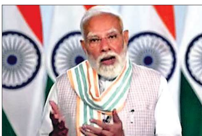
कराना चाहिए. प्रधानमंत्री ने कहा कि बच्चे, बुजुर्ग और बाहर काम करने वाले लोग अत्यधिक गर्मी में सबसे ज्यादा प्रभावित होते हैं. उन्होंने चेतावनी दी कि लक्ष्णों की अनदेखी करने पर स्थिति गंभीर होकर हीटस्ट्रोक का रूप ले सकती है. मोदी ने लोगों से अपने माता-पिता, दादा-दादी और अन्य बुजुर्ग परिजनों का विशेष ध्यान

नई दिल्ली: प्रधानमंत्री नरेन्द्र मोदी ने देश के विभिन्न हिस्सों में पड़ रही भीषण गर्मी और लू की स्थिति के बीच नागरिकों से सतर्क रहने और सभी आवश्यक सावधानियां अपनाने की अपील की है. उन्होंने लोगों से पर्याप्त मात्रा में पानी पीने, बाहर निकलते समय पानी साथ रखने और जरूरतमंदों को पानी उपलब्ध कराने का आग्रह किया. प्रधानमंत्री ने बुधवार को सांझा मीडिया मंच एक्स पर कई पोस्ट साझा करते हुए कहा कि अत्यधिक गर्मी सभी के लिए चुनौतीपूर्ण है. उन्होंने लोगों को हीट एजिजेशन के लक्षणों जैसे चक्कर आना, मतली और अत्यधिक थकान को नजरअंदाज नहीं करने की सलाह दी. उन्होंने कहा कि यदि किसी व्यक्ति को कमजोरी, सिरदर्द या अस्वस्थता महसूस हो तो उसे तुरंत ठंडी और छायादार जगह पर ले जाकर पानी और ओआरएस उपलब्ध