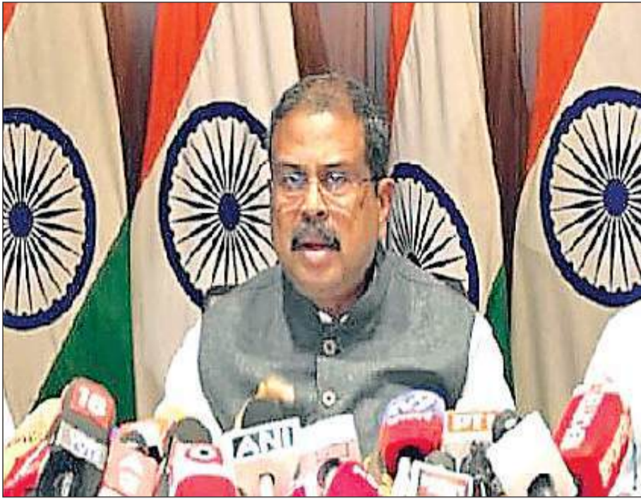
प्राथमिकता है। मैं समाज से, विशेष रूप से छात्रों से अपील करना चाहता हूँ कि वे बिना किसी डर

प्रधान ने बताया कि पुनः परीक्षा की अवधि 15 मिनट बढ़ा दी गई है और उम्मीदवारों को परीक्षा के लिए अपनी सुविधा के अनुसार शहर चुनने का मौका फिर से मिलेगा और उन्हें 14 जून तक प्रवेश पत्र मिल जाएगा। उन्होंने कहा कि केंद्र सरकार राज्य सरकारों के साथ मिलकर छात्रों के लिए परिवहन व्यवस्था का समन्वय भी करेगी। उन्होंने कहा, छात्रों का भविष्य हमारी सर्वोच्च प्राथमिकता है। मैं समाज से, विशेष रूप से छात्रों से अपील करना चाहता हूँ कि वे बिना किसी डर