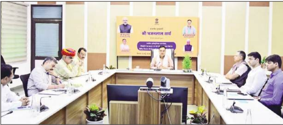
मुख्यमंत्री भजनलाल शर्मा ने प्रदेश में निवेश को प्रोत्साहित करने के लिए हर क्षेत्र में प्रतिबद्ध होकर कार्य कर रही है. गत दो वर्षों से अधिक समय में 35 नीतियों को लागू कर राज्य सरकार ने अनुकूल औद्योगिक वातावरण का निर्माण किया है, जो कि विकसित भारत-विकसित राजस्थान/2047 की ओर महत्वपूर्ण कदम है. उन्होंने कहा कि राजस्थान को ऊर्जा क्षेत्र में सिरमौर बनाने के क्रम में पवन और सौर ऊर्जा सहित अक्षय ऊर्जा की दिशा में भी तेजी से कार्य किया जा रहा है. मुख्यमंत्री शुक्रवार को मुख्यमंत्री निवास पर वीसी के माध्यम से भिवाड़ी में एलसीआ इलेक्ट्रॉनिक्स कॉम्प्लेक्स, 34 एमएलडी एसटीपी एवं खैरवाल-तिजारा जिले के विभिन्न विकास कार्यों सहित अन्य परियोजनाओं के शिलान्यास-लोकारंभ कार्यक्रम को संबोधित कर रहे थे.

उन्होंने कहा कि प्रदेश को रीजनल रैपिड ट्रांजिट सिस्टम (आरआरटीएस) द्वारा हरियाणा के रास्ते दिल्ली से जोड़ने की परियोजना पर कार्य किया जा रहा है. वहीं, यमुना जल समझौते के तहत क्रियान्वयन के साथ ही, सरकार अलवर पर तेजी से कार्य किया जा रहा है. वहीं, 24 जिलों में किसानों को दिन के समय में बिजली आपूर्ति की जा रही है. उन्होंने कहा कि राज्य सरकार ने 4 लाख भर्तियों को संकल्प को पूरा करने की दिशा में सवा लाख से अधिक युवाओं के नेतृत्व में प्रधानमंत्री ग्राम और वार्ड के सुनियोजित विकास के लिए विकसित ग्राम-वार्ड अभियान की दूरगामी पहल की है. इसके अन्तर्गत राज्य सरकार सांस्कृतिक विरासत, पर्यावरण और आवश्यकताओं को समाहित करते हुए गांवों के विकास का ब्लू प्रिंट तैयार कर रही है. उन्होंने कहा कि राज्य सरकार ने ग्रामीण युवाओं की सुविधाओं के दृष्टिगत पंचायत स्तर पर अटल ज्ञान केन्द्र खोलने का अहम निर्णय भी किया है.