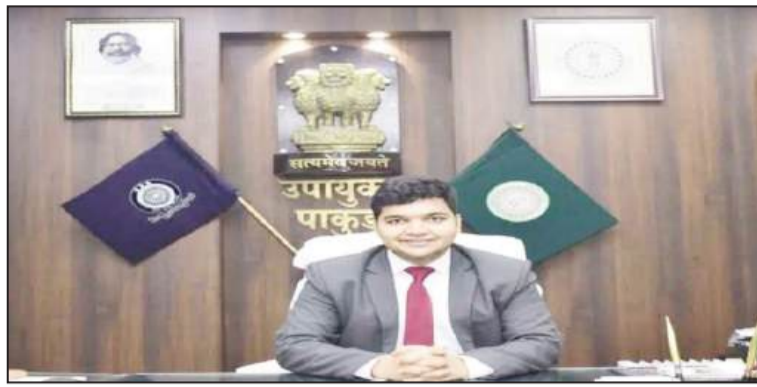
उपलब्धि जिले के शिक्षण तंत्र की मजबूती को दर्शाती है. प्रोजेक्ट परख 2.0 की अहम भूमिका: जिला प्रशासन द्वारा संचालित प्रोजेक्ट परख 2.0 ने इस सफलता में महत्वपूर्ण योगदान दिया है.

पाकुड़ : जिले ने शिक्षा के क्षेत्र में एक नया कीर्तिमान स्थापित करते हुए 11वीं कक्षा के परीक्षाफल में उल्लेखनीय सफलता हासिल की है. जिले ने पूर्व के 12वें स्थान से छलांग लगाते हुए इस वर्ष तीसरा स्थान प्राप्त किया है, जो समर्पित प्रयासों और बेहतर शैक्षणिक वातावरण का परिणाम है. इस वर्ष कुल 99.59 प्रतिशत विद्यार्थी उत्तीर्ण हुए हैं, जो जिले की शैक्षणिक गुणवत्ता में निरंतर सुधार को दर्शाता है. पिछले वर्ष की तुलना में इस वर्ष 1 प्रतिशत की वृद्धि दर्ज की गई है, जो एक सकारात्मक संकेत है. परिणाम सुधार में भी तीसरा स्थान केवल समग्र परिणाम ही नहीं, बल्कि परीक्षाफल में सुधार की दृष्टि से भी पाकुड़ जिले ने राज्य में तीसरा स्थान प्राप्त किया है. यह