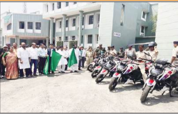
जरिए पुलिस जवान जल्दी मौके पर पहुंच सकेंगे, जिससे अपराधियों पर दबाव बनेगा और घटनाओं पर समय रहते काबू पाया जा सकेगा. हर थाना और ओपी को मिला फायदा: इन 18 बाइकों को जिले के अलग-अलग थाना और ओपी में बांटा गया है. इससे हर इलाके में पुलिस की