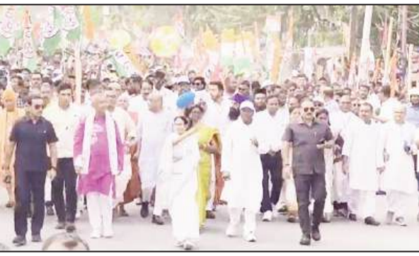
देखने के लिए जुटे और मोबाइल से तस्वीरें लेते नजर आए. हालांकि, इस