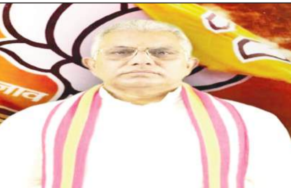
उन्होंने देश के प्रधानमंत्री नरेंद्र मोदी को 'घुसपैठिया' कहा। घोष ने इसे

खड़गपुर : दिलीप घोष ने रविवार को खड़गपुर में स्वामी घणवानंद के 131वें पुण्य आविर्भाव के अवसर पर भारत सेवाश्रम संघ द्वारा आयोजित वार्षिक महोत्सव में शिरकत कर जनसभा को संबोधित किया। इस दौरान बड़ी संख्या में श्रद्धालुओं और स्थानीय लोगों की उपस्थिति देखी गई, जहां घोष ने अपने संबोधन में राज्य में मुख्य मुद्दों को भी प्रमुखता से उठाया। सुबह से ही खड़गपुर में सभा को संबोधित करते हुए घोष ने राज्य की मुख्यमंत्री ममता बनर्जी के उस बयान पर तीखी प्रतिक्रिया दी, जिसमें