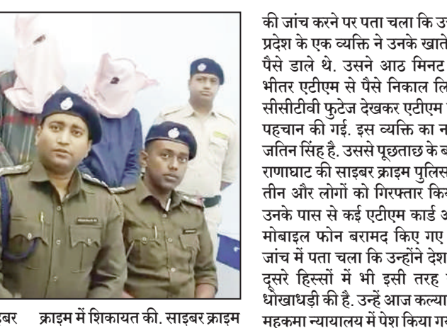
उसने तुरंत केस दर्ज कराया। साइबर क्राइम में शिकायत की। साइबर क्राइम

कोलकाता: राणाघाट साइबर क्राइम पुलिस ने उत्तर प्रदेश से 4 जालसाजों को गिरफ्तार किया है। उन्हें आज कल्याणी महकमा न्यायालय में पेश किया गया। 5 जनवरी को एक व्यक्ति को उसके मोबाइल फोन पर मैसेज आया, जिसमें बताया गया कि उसे एसबीआई रिवाइर्स की ओर से मैसेज मिला है और 14,453 रुपये का इनाम मिला है। उसके साथ एक लिंक आया, उसने उस पर क्लिक किया तो देखा कि एसबीआई का लिंक था, लेकिन उसने यूआरएल चेक नहीं किया। वहां एक ओटीपी आया, ओटीपी डालते ही उसके 50,000 रुपये डेबिट हो गए।